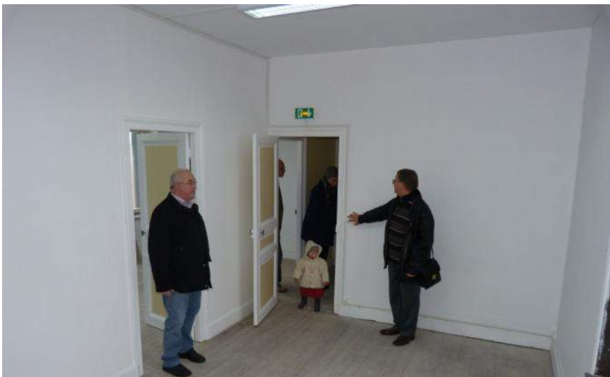
Outre les installations électriques, la société en charge des travaux a également effectué la mise aux normes conformément à la législation pour les établissements recevant du public.

En 2012, il restera l'installation des menuiseries et du chauffage avant que ce nouvel équipement soit ouvert aux associations et donc aux habitants de Glaire.