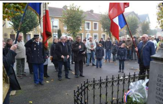
Beaucoup de monde à Glair pendant la cérémonie commémorative.

En cette période hivernale, la nuit tombe vite, protégez vous en vous signalant pour que les automobilistes puissent vous repérer de loin. Arborez un gilet ou un brassard fluo.