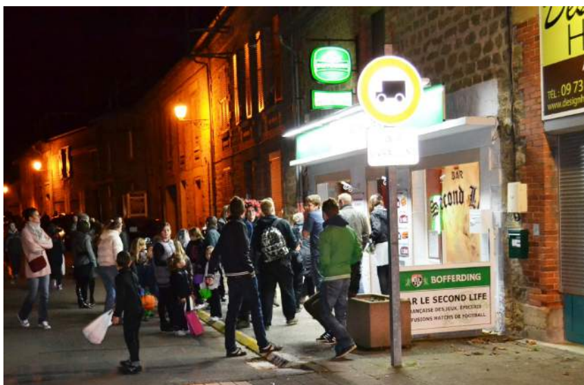
Pour l'occasion, le café de Glair avait ouvert exceptionnellement ses portes le jeudi, jour habituel de fermeture pour distribuer des bonbons aux enfants.

Tout juste les organisateurs regrettent-ils parfois de voir quelques parents prendre la tangente avec un sac bien rempli pour ne pas avoir à le partager avec les autres petits monstres du Cortège. On est alors bien loin de l'esprit souhaité par l'association organisatrice !