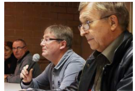
L'A.S. Sommer a chaleureusement remercié la Commune de Glaire pour leur collaboration lors de la Corrida 2013.