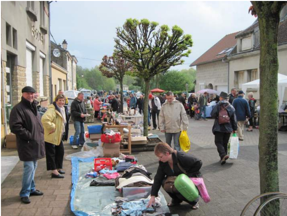
A de rares moments, les badauds ont tout de même pu profiter des stands des exposants qui n'avaient pas remballé à la première averse de 7h du matin.

Ce n'est que partie remise. Le temps ne pourra pas être pire en 2011 !