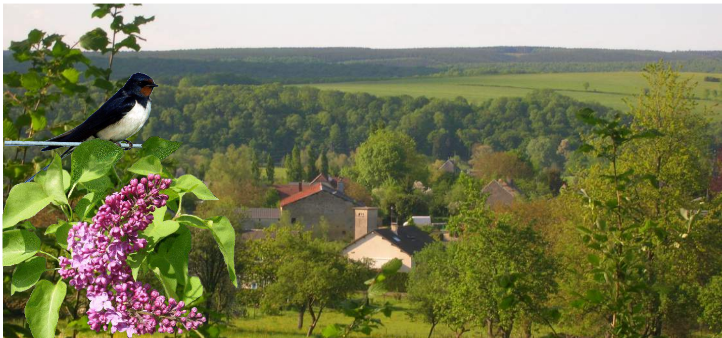
Symboles du printemps, les hirondelles sont toujours attendues avec impatience en même temps que la floraison du Lilas.

et les cyclistes se sont à nouveau appropriés la Presqu'île. En quelques jours, nous voilà presque en été !