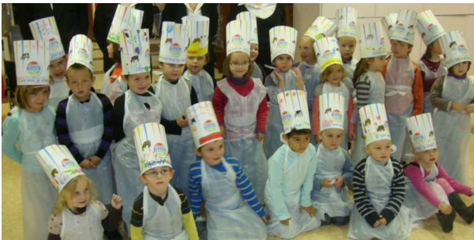
Une belle brochette de cuisiniers en herbe ont posé pour la photo souvenir. Nul doute que parmi eux, certains se découvriront une vocation dans l'Art culinaire

Les élèves de l'Ecole primaire sont allés à la lycée hôtelier de Bazeilles tandis que