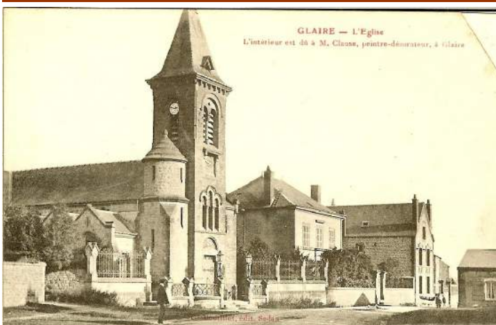
Ci-dessus, une nouvelle carte de Glaire représentant la commune avant les destructions d'août 1914. La construction en bas à droite n'existe plus.