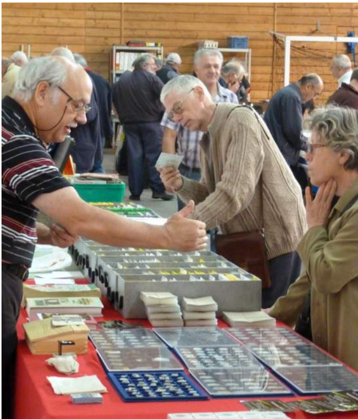
Des centaines de passionnés viennent chaque année dans l'espoir de « dégoter » LA carte qui leur manque pour compléter leur collection.

Il suffit d'écouter les commentaires des uns ou des autres pour se convaincre que l'opération est une réussite. Comme pour la Corrida de Glaire, la commune montre qu'elle sait faire preuve de solidarité pour le Sedanais.