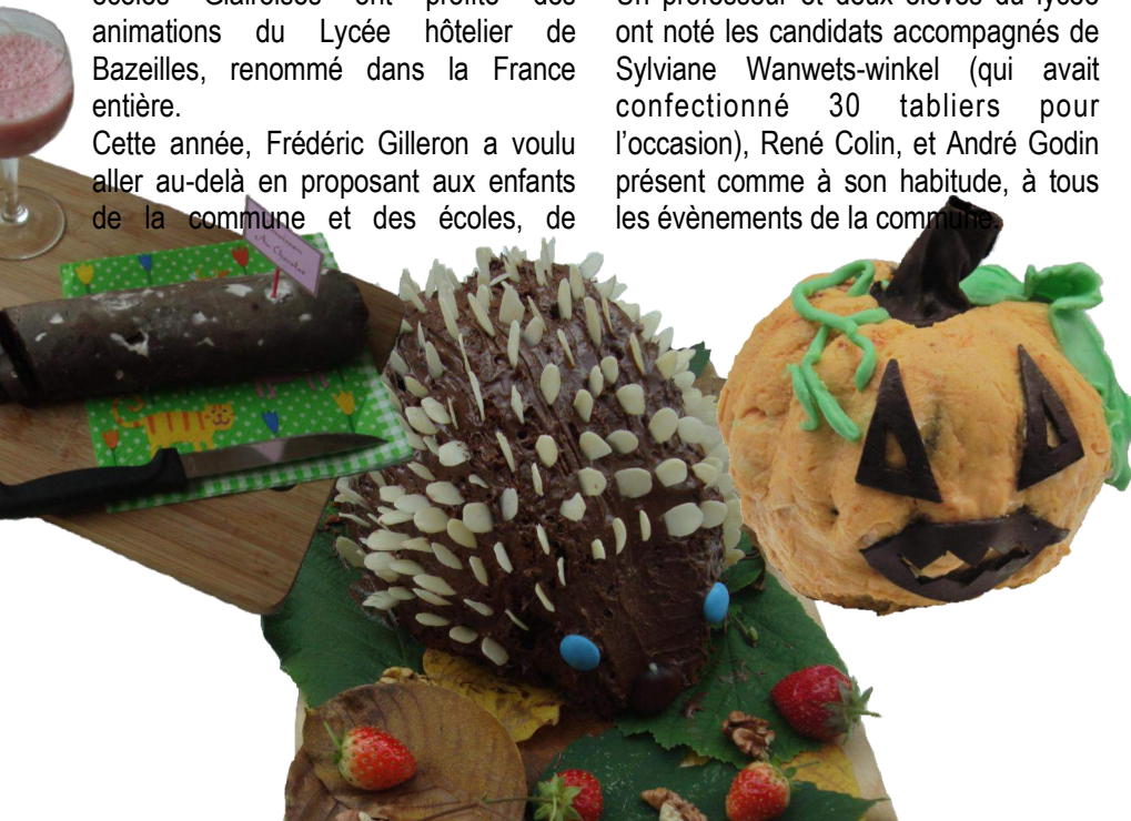
Le trio gagnant du premier concours Master mini chef : le saucisson au chocolat, le hérisson au chocolat et la citrouille ... au chocolat !