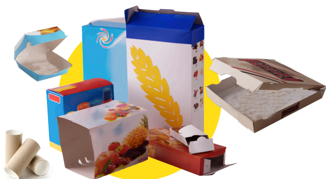
Petits emballages en carton