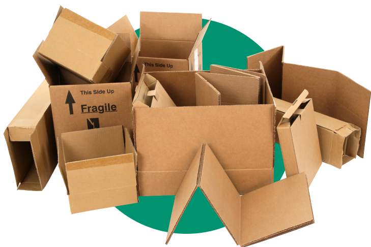
Grands emballages en carton

▶ Afin de gagner de la place dans votre bac/sac de tri, vous pouvez aplatir vos cartons et cartonnettes.