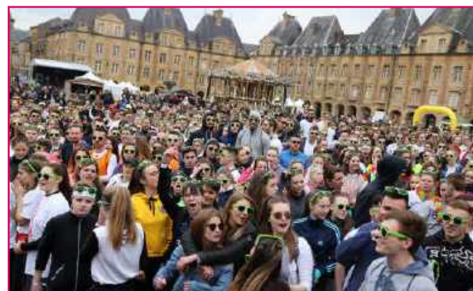
Gacolor sur la place Ducale, le 1 er avril 2018, rendez-vous festif incontournable pour les étudiants du territoire