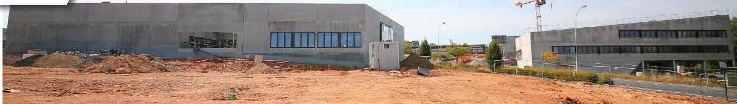
Sur le chantier du campus, le gros œuvre s'achève... La maison des étudiants est la plus avancée et sa livraison est toujours prévue pour la fin d'année. Côté pôle formations de la CCI, on en est au cloisonnement intérieur, quant à l'extension de l'IUT, sa couverture sera entièrement posée à la mi-septembre. À l'extérieur, la passerelle de liaison entre la CCI et l'IUT a été également exécutée en totalité et la dernière grue aura disparue à la fin du mois.