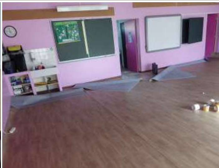
Salle de classe de l'école élémentaire

Créé en 1993 sur le site de Tarkett Sedan, le Centre d'Expertise Tarkett (TEC) est en charge de la formation des entreprises de pose et de la validation des revêtements de sols fabriqués en Europe.