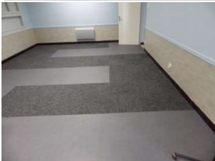
Salle des fêtes de Iges