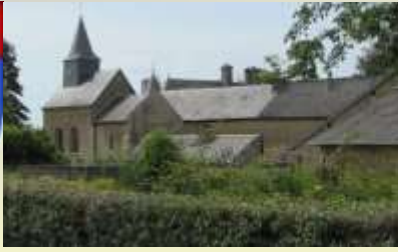
Villette commune de Glaire