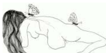
« La grande papillon » Dessin de Delphine Guy

Instinctive Expédiée dans l'Antarctique Reviens-nous petite sœur Quand le nouveau-né réclame à boire l'essence Jour de solde des poupées