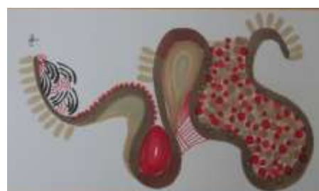
Trois des 150 briques de Delphine Guy inspirées / imprégnées par la Meuse