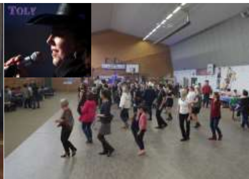
Le bal des infatigables animé par la chanteuse TOLY